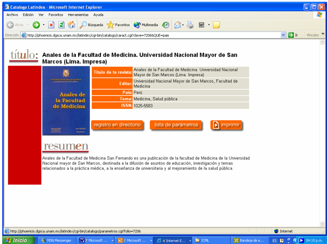
Fig. 2: Catálogo Latindex